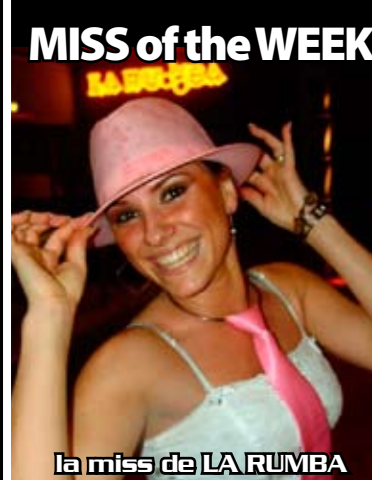
la miss de LA RUMBA

Responsabile di Redazione: Emanuele M. Barboni