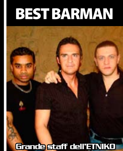
Grande Staff dell'ETNIKO

scarica, guarda e commenta le foto www.tamtammilano.it